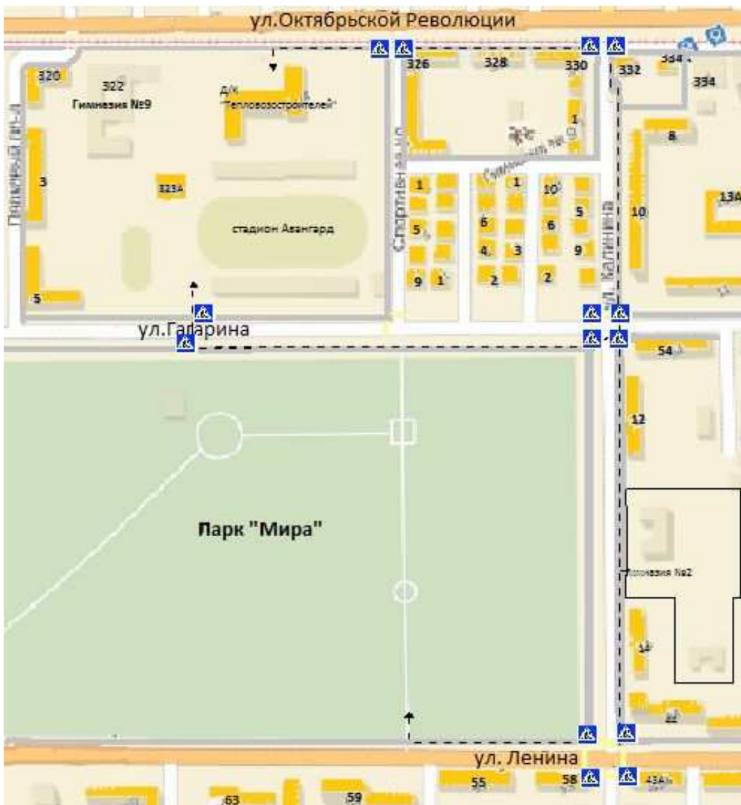
СХЕМА безопасных маршрутов учащихся гимназии № 2