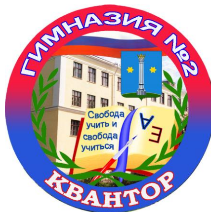
Рисунок 2 – Нагрудный знак